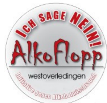
Alkoflopp-Siegel der Gemeinde Westoverledingen

Zu einem Diskussions- und Informationsabend sollen die Inhaber, Betreiber und MitarbeiterInnen von Einzelhandelsgeschäften und gastronomischen Betrieben eingeladen werden. Neben einem Exkurs in die derzeitige Problemlage „Alkohol und Jugend“ soll dieser Abend in erster Linie zur Diskussion im Umgang mit dem Problem dienen. Erfahrungsberichte, Fragen und Vorschläge für eine verbesserte Kooperation aller Beteiligten sollen ebenso einen Raum finden. Es wird zudem die „Charta zum Jugendschutz“ vorgestellt, die die anwesenden Betriebe (unmittelbar oder später) unterzeichnen können. Diese Charta wird Ihnen dann als Aushang mit dem Alkoflopp-Siegel der Gemeinde Westoverledingen überreicht (werden).